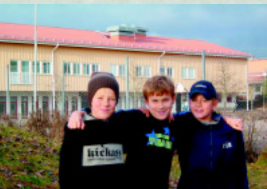
Elever från Simonstorp som inte var glada åt flytten till Jurslaskolan.