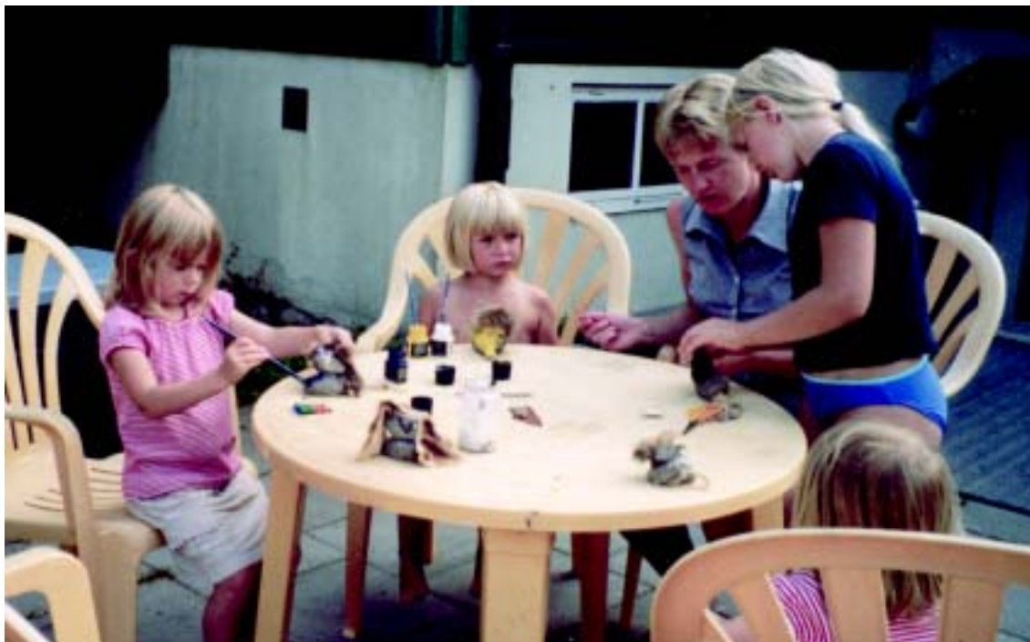
Småtrollen gör stentroll.