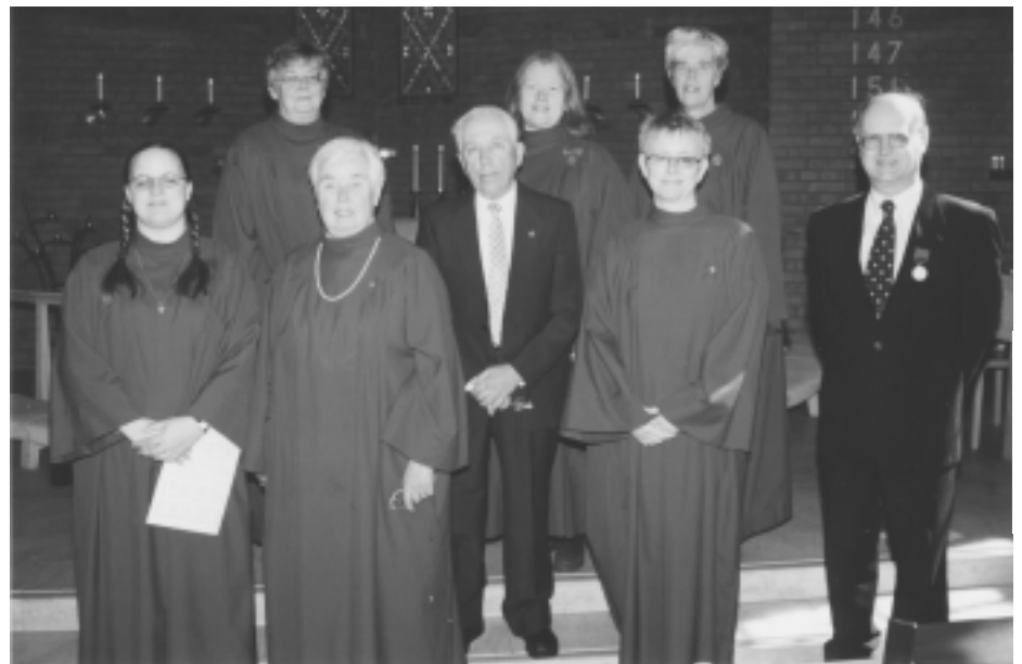
Kyrkokören fick förtjänsttecken i Ättetorpskyrkan på Påskdagen.